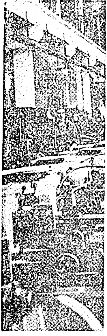
O secvență din secția montaj a Uzinei de strunguri. Aici piesele asamblate dau naștere strungurilor românești.