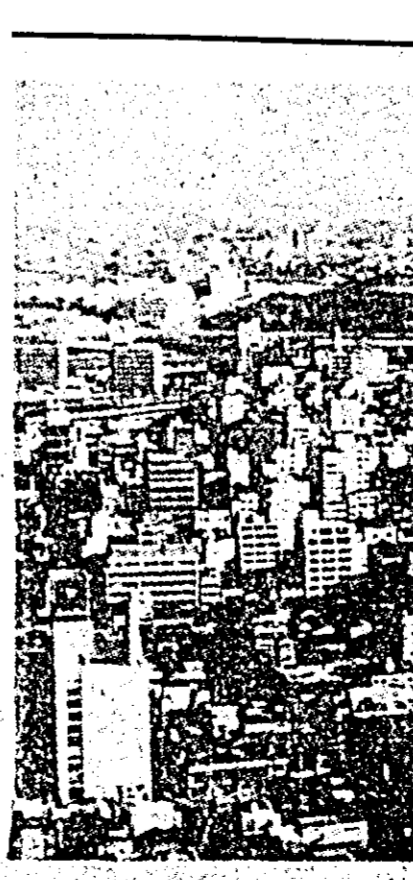
JAPONIA — Vedere din „orașul crizantemelor” Tokyo, marea metropolă a Țării Soarelui răsare.

Conferința de la Washington care s-a încheiat săptămîna trecută nu a dus la nici un rezultat. Comunicatul final exprimă numai dorința ambelor părți de a examina în continuare posibilitățile realizării unei colaborări mai strînse în vederea intensificării luptei împotriva criminalității. Trebuie recunoscut că aceasta este foarte puțin. În comparație cu dorințele și așteptările guvernului american. De aceea, la Washington nu se ascunde faptul că în lupta împotriva „crimei organizate” autoritățile americane vor trebui să facă față în viitor unei enorme dificultăți.