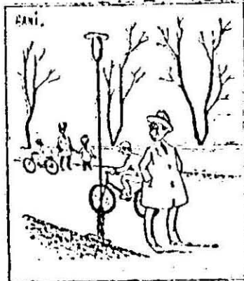
O fi vreun sport nou? Slalom cu bicicleta printre oameni!!!

Odată cu sosirea zilelor frumoase de primăvară, mulți locuitori ai Aradului își îndreaptă pașii spre frumoasa vale a Mureșului. Dar, în același timp și biciclistii se îndreaptă spre același loc deși aici circulația bicicletelor e interzisă astfel că plimbarea celor dinții devine uneori neplăcută și chiar riscantă.