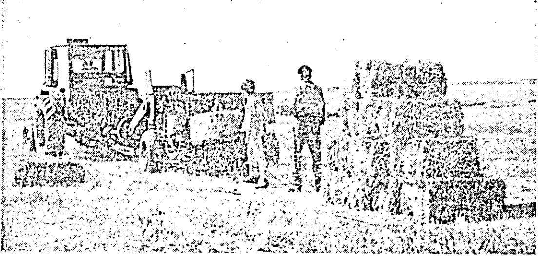
La C.A.P. Comlăuș, eliberarea terenului pentru culturile duble constituie o acțiune prioritară în aceste zile.

mînta e încorporată în patul germinativ. Prin tăvălugire, pămîntul se așază mai bine făcînd un contact mai bun cu sămînța de porumb și asigură astfel condiții mai bune de germinare.