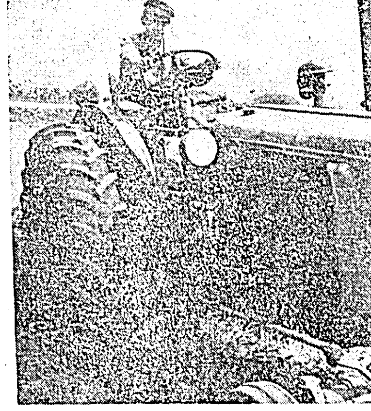
În aceste zile mecanizatorii de la S.M.T. Aradul-Nou se preocupă intens de executarea arăturilor de vară pe terenurile eliberate de păioase.

În gospodăriile colective din raza orașului nostru, după terminarea recoltei, colectiviștii au început transportul snopilor la arși și treierul. Până sîmbătă s-a început treierul cu 5 batoze. Astfel, la gospodăriile colective din Tisa Nouă, Vladimirescu și Gai — sălășe se treieră grul, la gospodăria colectivă „Partizanul” mazărea, iar la gospodăria colectivă „Unirea” orzul. Începînd de ieri, s-au mai pus în funcție încă trei batoze la treieratul grului la Aradul Nou, Tisa Nouă și Gai-Bujac.