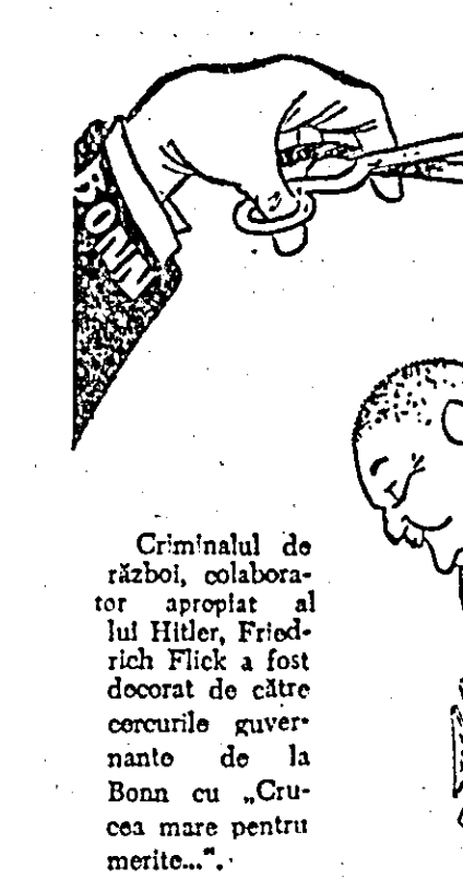
JUSTIȚIA DE LA BONN. Desen de A. RIK

La Cambridge (Maryland) poliția locală a folosit baloane și gaze lacrimogene pentru a împiedica o demonstrație împotriva segregăției. După cum se știe, orașul Cambridge se află sub lozina marșală, instituită de autoritățile locale împotriva demonstrațiilor populației de culoare. Orașul este sub controlul trupelor gării naționale (unitățile locale de sub îndrumarea statului), iar demonstrațiile împotriva segregăției au fost interzise de autoritățile statului Maryland.