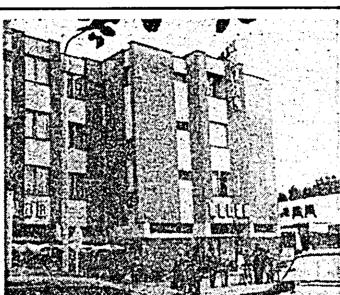
Ineu: se înalță mereu siluetele zvelte ale modernelor blocuri.

Prin întreaga sa desfășurare, prin conținutul programului de măsuri adoptat, merită să sporească eficiența întregii activități. Colectivul secției și-a demonstrat nu doar hotărîrea, dar și capacitatea de a îndeplini și depăși sarcinile ce-i stau în față.