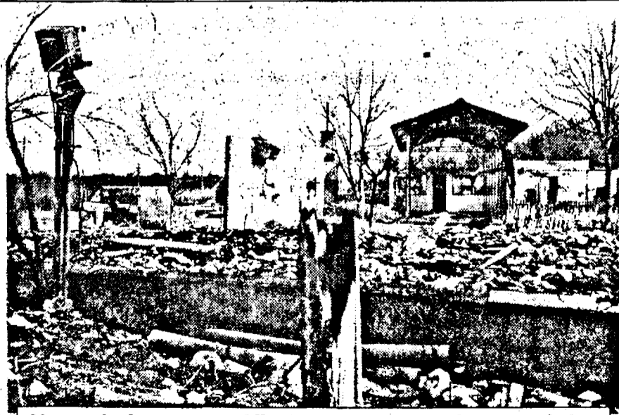
Un sat de vacanță de care s-a ales praful...