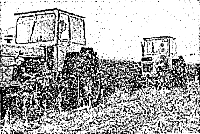
De îndată ce eliberează terenul de porumb, plugurile trag brazdă nouă pentru viitoare recolte pe ogoarele consiliului agroindustrial Pecica.