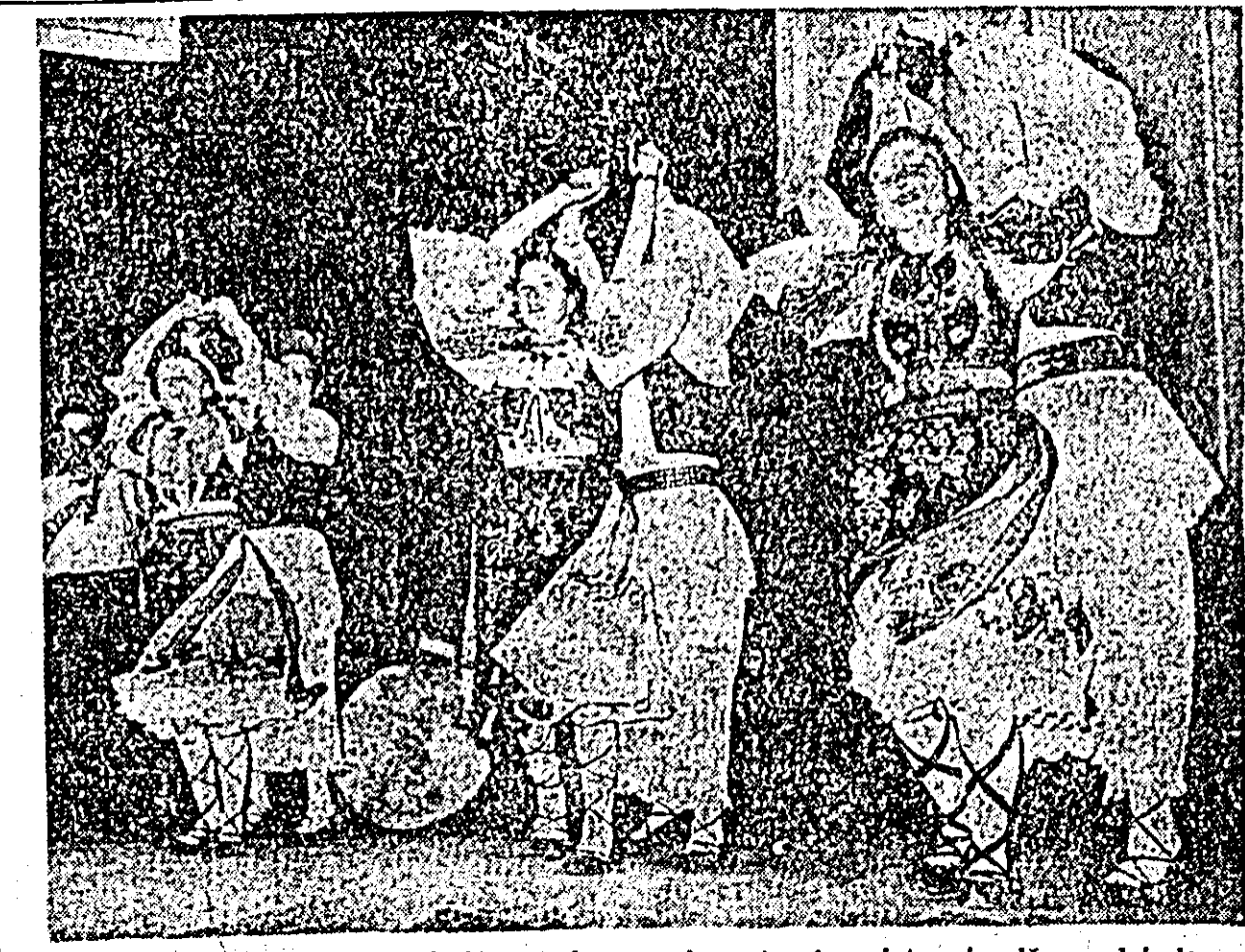
Simbătă și duminică s-a desfășurat în orașul nostru faza internațională a celui de-al III-lea concurs al formațiilor de artiști amatori. Iată-l, în pitorești costume naționale, pe tinerii artiști amatori din comuna Căpîlnaș executînd cu mult avînt un frumos dans popular bănățean. Citiți în pagina a II-a articolul intitulat: „O reușită trecere în revistă a activității culturale-artistice”.

În cinstea celui de-al III-lea Congres al P.M.R., constructorii de mașini agricole de la Uzina metalurgică „Vasile Roșia” din Capitală au introdus recent în fabricație de serie un tip de semănătoare universală care reprezintă o variantă a semănătorii universale de păloase fabricată pînă acum, îmbunătățită din punct de vedere constructiv. Cu această mașină se poate însemna o mare varietate de semințe cum sînt: grâu, orz, ovăz, floarea-soarelui etc. Fiind prevăzută cu comenzi hidraulice, semănătoarea poate fi manevrată cu ușurință de către tractorist. În fața mașinii sînt montate scormonitoare speciale care afinează și uniformizează solul în urma roților tractorului. La producția de semănători de acest tip prevăzută pe anul 1960 colectivul uzinilor va economisi peste 570 tone de metal. (Agerpres).