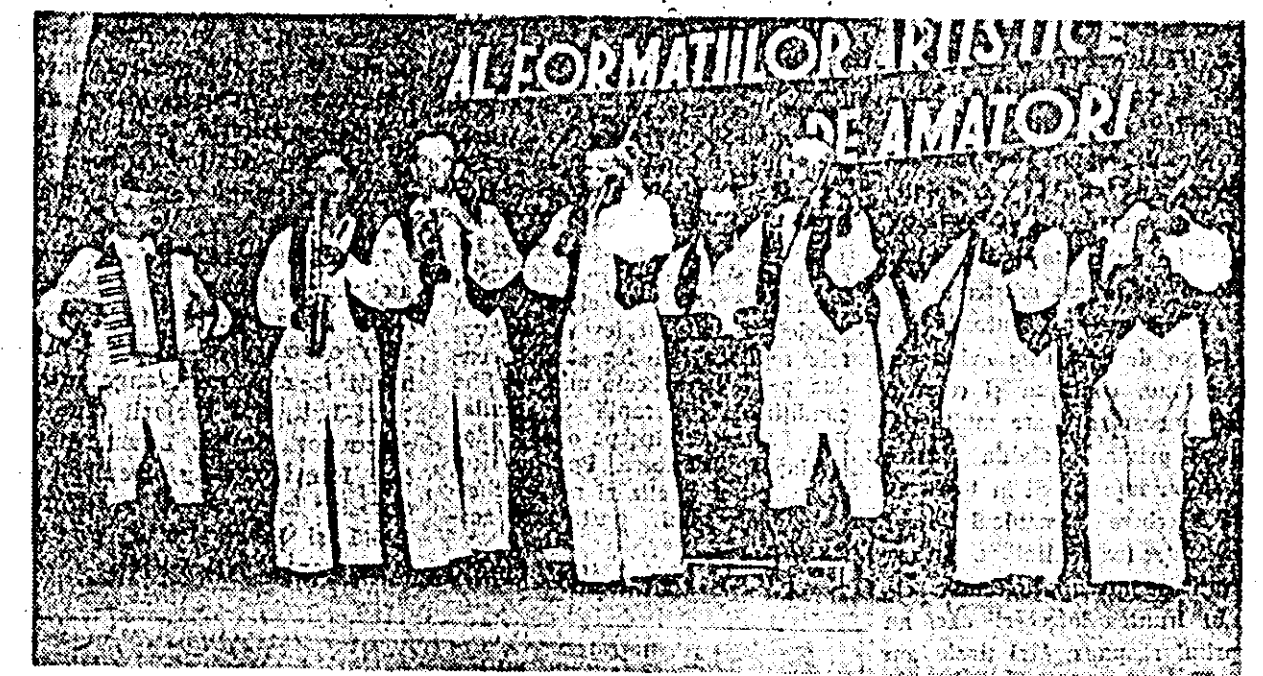
Taraful căminului cultural din comuna Firiteaz.