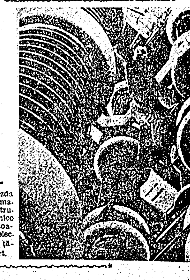
La Drezda (R. D. Germană) se construiesc puternice transformatoare pentru electrificarea țării și export.

În primele patru luni și jumătate din acest an agricultura a primit cu aproape 90.000 de tone mai multe îngrășăminte chimice decît în aceeași perioadă a anului trecut. Sporul producției de îngrășăminte chimice obținut în ultimii ani s-a realizat pe seama intrării în funcțiune a unor noi unități, printre care Uzina de superfosfați și acid sulfuric de la Năvodari și pe seama modernizării proceselor tehnologice la fabricile mai vechi. De pildă, numai Uzinele de îngrășăminte chimice „Petru Poni” din Valea Călugărească, datorită schimbării procedurii de fabricație, produc anul acesta 130.000 tone superfosfați, față de 40.000 tone în anul 1955. Îndeplinind planul de producție pe acest an la îngrășăminte chimice lucrătorii din industria chimică vor obține o producție de 6,4 ori mai mare decît în 1955. Mari perspective deschide industria de îngrășăminte chimice realizarea prevederilor din proiectul de Directive ale Congresului al III-lea al partidului. În 1965 agricultura urmează să primească circa 2.000.000 tone de îngrășăminte chimice ceea ce va contribui într-o măsură însemnată la obținerea celor 14-16 milioane tone cereale și leguminoase boabe prevăzute pentru anul 1965.