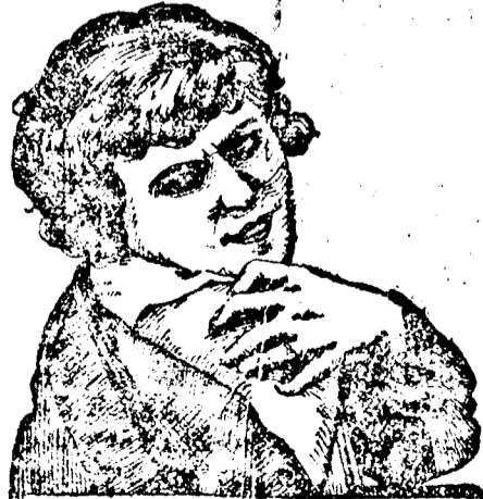
Az izgaló és penniblis hímlők azonnal elhúznak, ha a CADUM-KENŐCSÖT használja