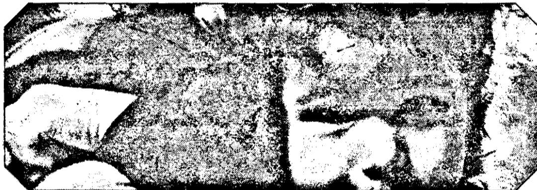
mite, printr-un simplu contact cotidian cu o persoană infectată și meru apar manifestări ale acestei temeri.

Între cei doi poli: frica permanentă și nesocotirea ei se situează majoritatea oamenilor, în acest al doilea deceniu de existență a SIDA. Adevărată