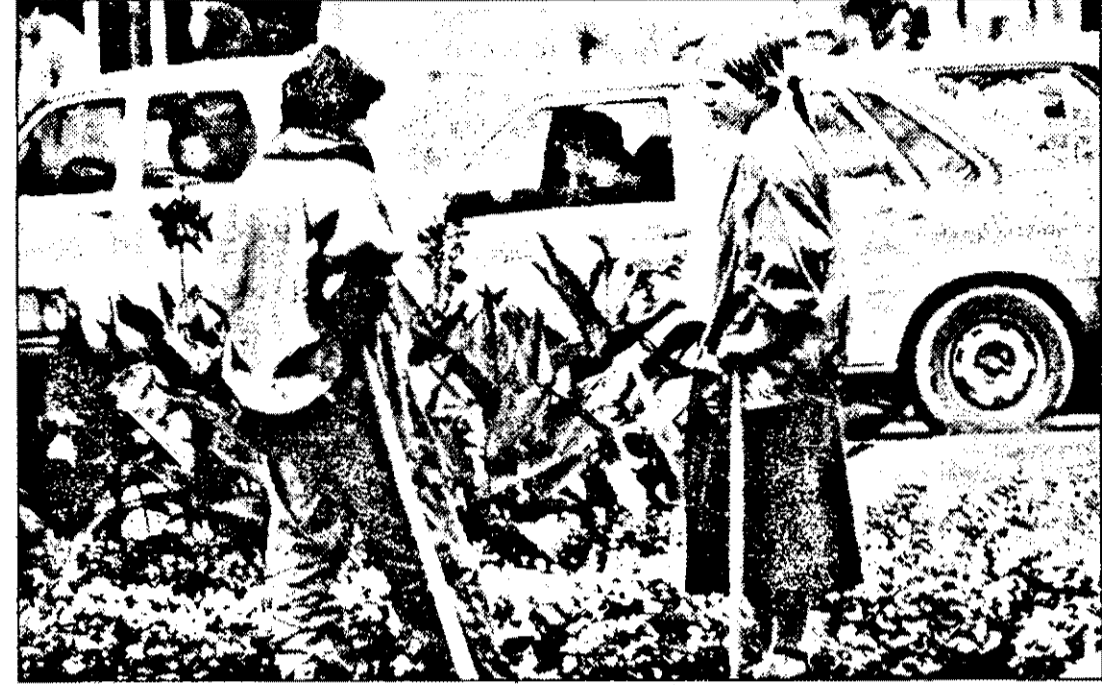
Ciomege au dar nu-s mineri...

Și când te gândești că există unii care, în fața acestei formidabile aventuri, în loc să promoveze ajustările structurale și adaptarea tehnologică, se agată cu disperare de industriile trecutului și de piețele trecutului, într-un fel de cerc vicios fără de speranță. Este chiar cazul încercării ca, de dragul unor avantaje derizorii pe termen scurt - cum ar fi de pildă găsirea între fostele țări membre ale CAER de debuşee reciproce pentru industriile falimentare - să riște sacrificarea oricărei șanse de a leși din actuala mediocritate a dezvoltării. Cu perspectiva marginalizării definitive. Împreună. (ILIE ȘERBANESCU, „Comentariul zilei”, Radio PRO FM, 22 septembrie 1994)