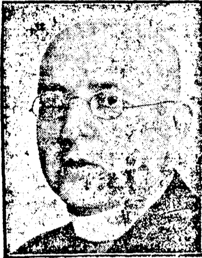
SEIPEL IGNÁC dr.

Hogy milyen mély gyökeret vert a Seipel által vezetett keresztényszociálisták a vidé-