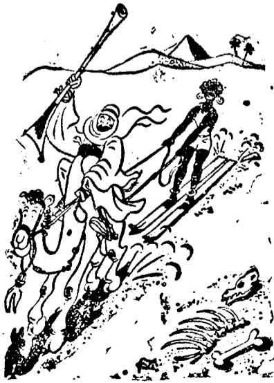
avagy: skijöring Abessziniában...