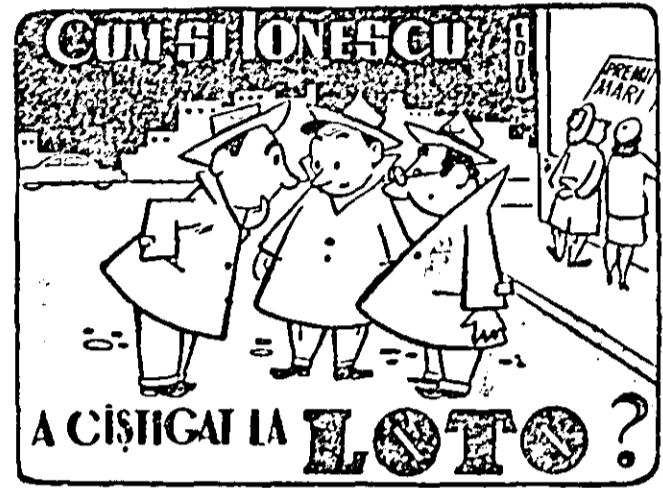
A CȘTIGAT LA LOTO?

Atît vaccinarea cît și revaccinarea antipoliomielitice sînt obligatorii și gratuite. SANEPIDUL ORĂȘENESC ARAD