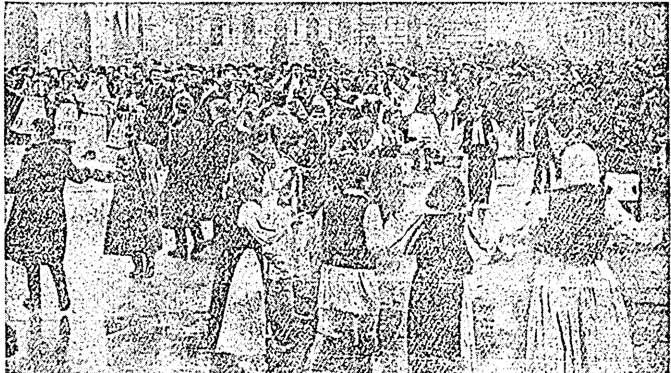
Mase compacte de oameni al muncii din orașul nostru au participat la manifestările organizate cu prilejul sărbătoririi Centenarului Unirii Țărilor Române. Cîșorul reprezintă un aspect de manifestarea ce a avut loc în piața Statului popular orașene. Prîni de mină, cei prezenți joacă Hora Unirii.