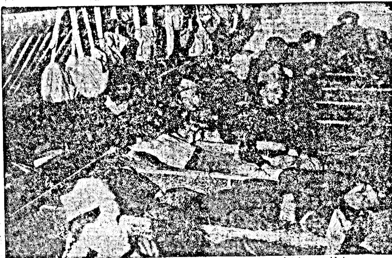
Undeva pe frontul de Vest, soldați francezi, odihnindu-se într'un grajd trans- format in cantonament.