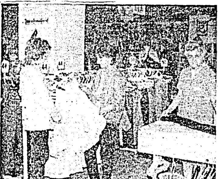
Magazinu universal „Ziridava”. Aspect din ralonul confeccii pentru femei.