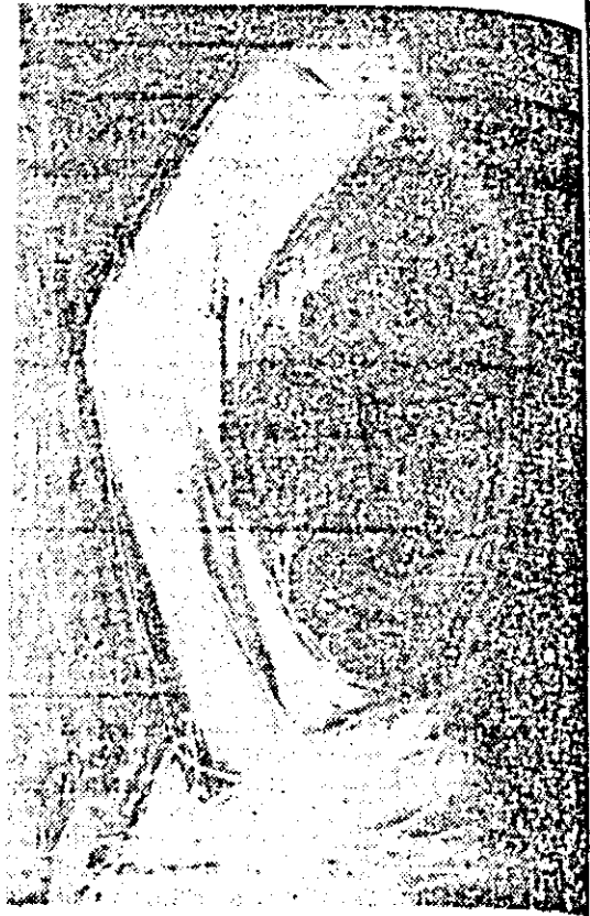
GYÖRFY EVA „Tărăș”