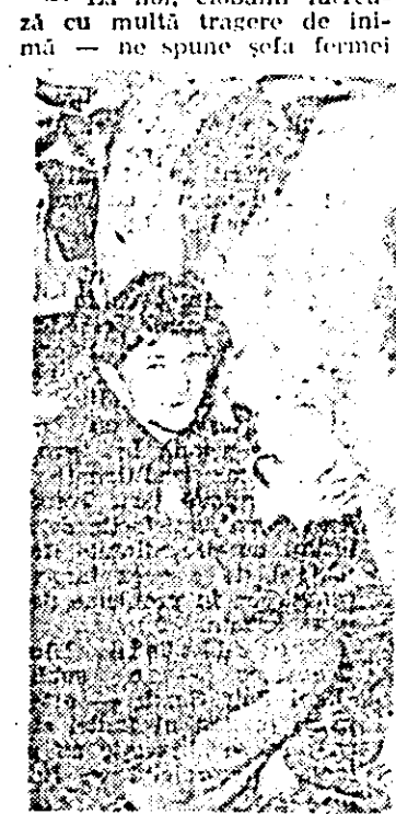
Fătul recent, un vițel este ajutat să găsească ugerul matern. Imagine surprinsă la C.A.P. Țipar I.

lână mai multă de la fiecare oaie, decît media realizată de ceilalți confrăți. De fapt, acest indicator important care este producția de lână a fost depășit cu 2200 kg, ceea ce înseamnă că de la fiecare oaie s-au obținut în medie, anul trecut, cîte patru kilograme și jumătate de lână. — La noi, ciobanii lucrează cu multă trageră de inimă — ne spune șefa fermei