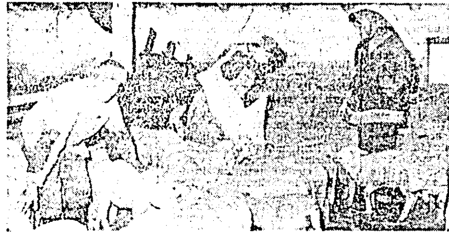
La ferma de ovine de la C.A.P. Nădab, 500 de miei frumoși sînt pregătiți pentru livrare.

După cum — sperăm — se vede, producțiile în zootehnie sînt hotărîte de om, de felul în care hrănește și îngrijește animalele. Iată de ce, la fiecare loc de muncă din ferme este necesar să se imprimе un spirit de ordine și disciplină. Esențială rămîne însă asigurarea furajelor în cantitatea prevăzută și de bună calitate. Acest lucru trebuie avut în vedere vara și toamna, atunci cînd se pot umple „cămășile” zootehniei pentru că iarna nu-ți rămîne decît să constăți ceea ce nu s-a realizat vara așa cum se cere. De aceea, credem că în acest an, direcția agricolă trebuie să ia măsurile ce se impun în vederea realizării integrale a furajelor prevăzute pe acest an. Iar ca măsură imediată, fermele care își consumă ultimele rezerve de furaje cum este cea de la C.A.P. Țipar II, să fie sprijinite să procure nutrețuri de la cele cu furaje excedentare.