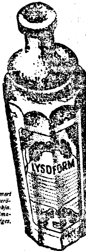
A Lysoform az ismert fertőtlenítőszer legérősebbje és legbiztosabbja. Minden otthonban elmaradhatatlanul szükséges.

Számos zavaró kellemetlen organikus női bajnak az a téves hit a forrása, hogy szappan és víz elegendőek a mindennapi „intim toalett”-hez. A Lysoform használata a legbiztosabb ellenszere minden ilyen eredetű zavarnak.