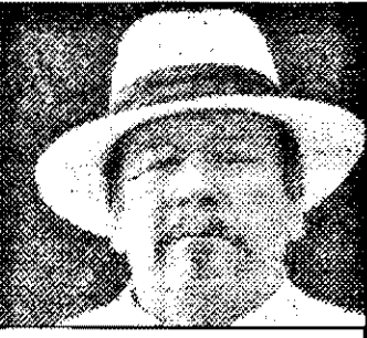
RTL-21,15 Charlie Chan și blestemul Reginei Dragonului, f. act. SUA 1981

6,15 Ben Crop - doc. Australia 7,05 Alf - s. am. 7,25 Des. anim. 8,45 Familia Walton - s. am.: Băiatul sălbatic 2 9,40 Micuța noastră fermă - s. am. 10,35 Kali - Zeița răzburării f.avent., rel. 12,35 O pereche ciudată - s. am.: Noaptea nopților 13,00 Cei doi Hart - s.pol. am. 1979: Rudenie periculoasă 14,00 Ingerii lui Charlie - s. act. am.: Inger în pericol 15,00 Arabella Kiesbauer show 16,00 Familia Colby - s. am.: Scrisoarea 16,55 Micuța noastră fermă - s. am.