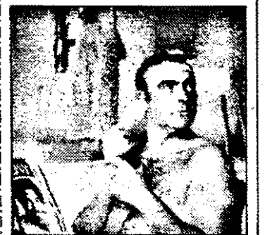
RTL-21.15 James Bond 007 - Diamante pentru veșnicie - fact.

8.30 Hello, Austria! - magazin 9.00 Știri ITN 9.30 Jurnal european - magazin 10.00 Video-moda