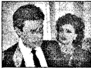
PRO 7 - 16,00 Familia Colby - s. SUA

6,30 Jurnalul regional 6,50 Magazin matinal: știri 7,00 Reuters - jurnal economic 7,44 Povesti 10,00 Albastru - magazin 10,35 Concurs TV 10,45 Pariul - s. Brazilia IX/4 12,20 Concurs TV 12,30 Oraș de frontiera - s. Franța - Canada 78/14. Vânătorul de capete