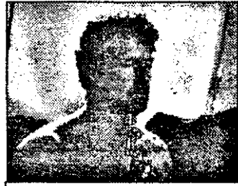
RTL-21.15 Iadul din Manitoba - f. avent. Germ.-Spania 1965

7.00 La prima oră. Știri, Buletin meteo, Informații utile, Desene animate 9.15 Ora de muzică 10.00 Telemagazin Worldnet 10.30 Panoramic european