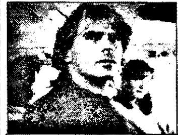
SATI-21,15 Mac Gyver - Comoara din Atlantida - ETV SUA, 1993

6,30 Viata satului 6,50 Jurnal regional 7,00 Magazin matinal, stiri 7,40 Reuters - jurnal economic 7,55 Povesti 10,00-13,00 Albastru - magazin 10,35 Concurs TV 10,45 Maigret si ingrijitoarea - s.pol.Anglia V/4 12,20 Concurs TV 12,30 Oraș de frontiera - s.Franta-Canada 78/13. Concert cu blănuri 13,00 Stiri 13,05 Magazin economic 14,55 Prezentarea programului 15,00 Magazin pentru handicapati 15,15 Medicină naturală 15,30 Tennis - Openul Australiei 16,30 Meditații la fizică 17,00 Stiri, meteo 17,05 Versuri 17,25 Domnișoara - s.Brazilia