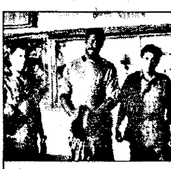
SATI-0,00 Black Cobra 2 - fact.Italia 1988

6,50 Alf - s.am. 7,15 Des.anim. 8,40 Waltonii - s.SUA: Luptă curajoasă 9,40 Micuța noastră fermă - s.SUA 10,40 Fata o șterge - comed.SUA, 1982, cu Dick van Dyke 12,30 O pereche ciudată - s.SUA: Felix, marele regizor