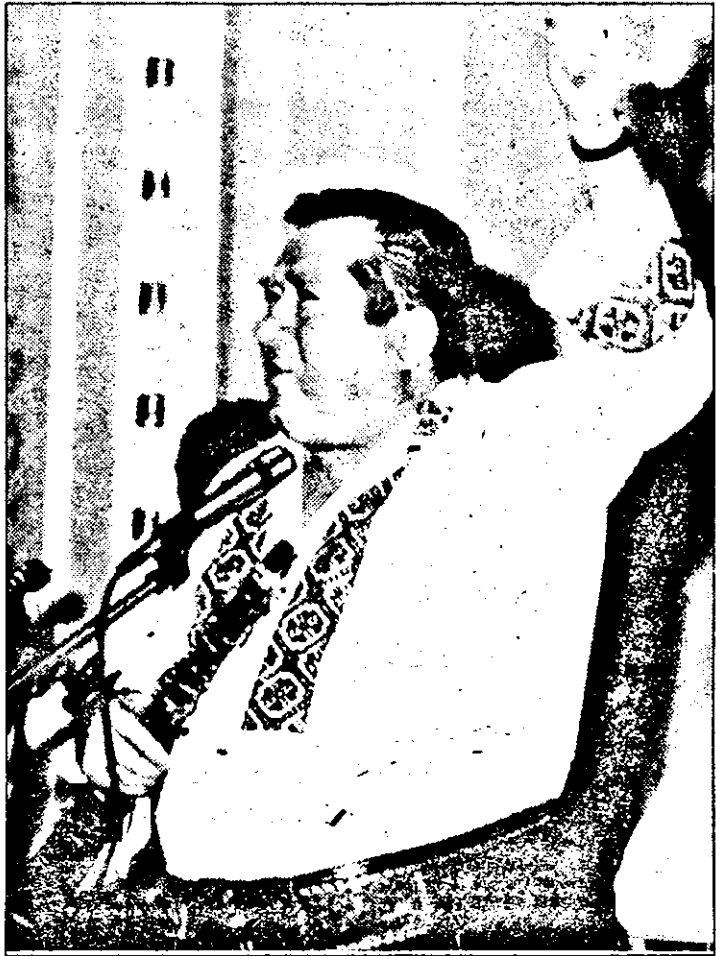
„Nu vom ceda o palmă de pământ...” ne convinge prin cântecul său DUMITRU FĂRCAȘ.