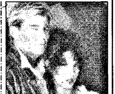
PRO7-0,15 Jocuri murdare - f. act. SUA 1988

8,15 Lumea afacerilor 8,45 Buletin financiar 9,00 Știri ITN 9,15 Afaceri magazin 9,30 Ediție internă - TBA 10,00 Supershop 11,00 Magazin financiar european 12,00 Rivera show 14,00 Azi - reportaje 15,00 Wall Street Journal 19,00 Azi - magazin informativ 20,00 Știri ITN 20,30 Magnați