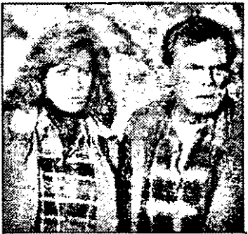
RTL-21,15 Cei doi Hart se întorc - f.pol. SUA, 1993

15,30 Tarzan - s.SUA: Stația finală, jungla 16,00 Star Trek - s.s.f.am. 16,55 Mac Gyver - s.am.: Banda celor 5 18,00 Riscă! - concurs TV 19,00 Totul ori nimic - concurs TV 20,00 Stiri, sport, meteo