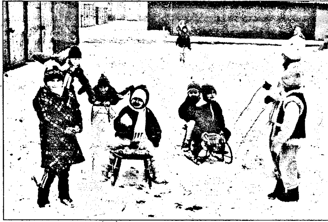
Zăpada căzută zilele trecute în Arad constituie un prilej de bucurie pentru copii și ar trebui să constituie un motiv de preocupare pentru adulți. Spunem „ar trebui”, deoarece gheața care continuă să transforme multe trotuare în veritabile patinoare, ca și numărul mare de cetățeni care au suferit fracturi nu par să indice că Aradul ar mai avea primar sau servicii de specialitate aflate în slujba cetățenilor.

incălecat p-un condei și ca să nu mai pată și altii ca el, așteaptă amu aceste rânduri prin care-i pune în gardă despre corectitudinea cu care lucrează cu clienții amintitu' patron! Nota me': Amu, precis, domnu' patron o să sară-n sus! Nime nu-l oprește decât propria lui conștiință. Ase' că n-are decât să aleagă între „a sări” și „a face orce pântru ași spăla rușine”. Doamne ajută! CONSTANTIN SIMION