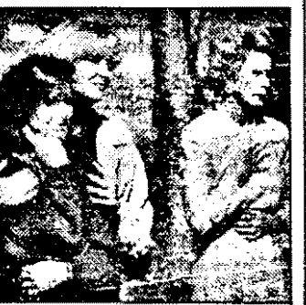
RTL-21,15 Maltratarea - f.SUA 1993

9,00 Stiri ITN 9,15 Bursa SUA 9,30 Inside edition - mag.inform.SUA 10,00 Super shop 11,00 Magazin financiar european 12,00 Riviera show 13,00 Magazin economic mondial 13,30 Financial Times 14,00 Azi - magazin informativ 14,30 Financial Times 15,00 Rosta banilor - informații de pe Wall Street 18,30 Financial Times 19,00 Azi - magazin informativ 20,00 Stiri ITN 20,30 Golf 21,30 Dataline - magazin