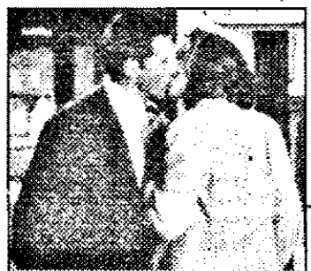
PRO7-21,15 Presupus inocent - f.pol.SUA 1990

8,23 Prezentarea programului 8,25 Corona vrăjii - d.a. 8,50 Cuvântul Domnului - religie 9,00 ABC calculatoare - mag. 9,30 Magazin distractiv duminical 12,00 Valsuri 12,50 Reportaj 13,05 Des. anim. 14,05 Domnișoara - f.ser. Brazilia 170/49-52 16,05 Delta - mag. șt. 16,35 Religie 17,00 Program Walt Disney - d.a. 18,05 Documentar 18,35 Magazinul provinciei 19,25 Roata norocului 20,00 Săptămâna - magazin 20,50 Știri, meteo 21,00 Versuri 21,10 Pantera - f.maghiar. 22,40 Zilele asediului - 22 ian. 1945