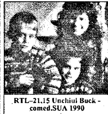
RTL-21,15 Unchiul Buck - comed. SUA 1990

1975 14,05 Turnătorul de clopote din Tirol - f. popular Germ 1956 15,45 Cursă infernală - f. act. - comed. SUA 1977 17,30 Prințesa Fantagiro - s. sf. Italia,