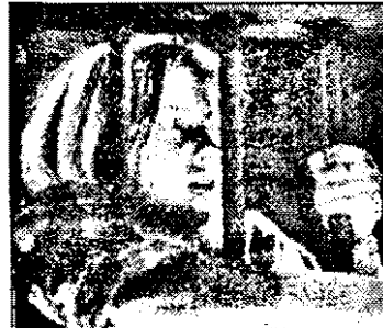
Pro7-23.15 Ghiare de tigru - f. karate Canada 1992

10.15 Vecinii - s. Australia 10.45 Zina roșie 11.15 Simțiri-vă bine! 11.45 Femeii! 12.45 Germania astăzi 13.00 Căile iubirii - s.am.: Între 2 femei!