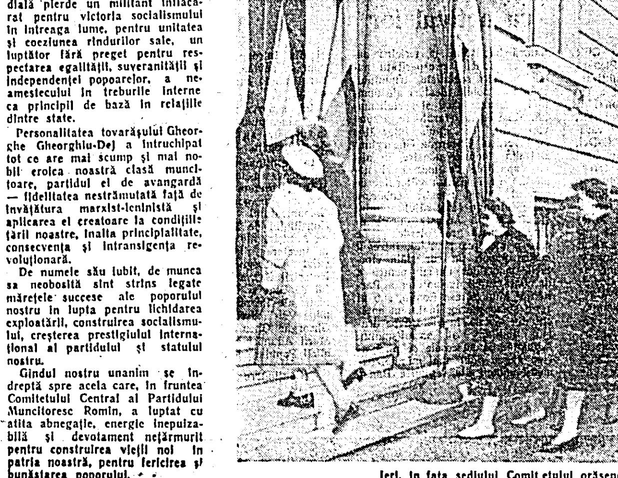
feri, în fața sedliului Comitetului orașenesc de partid Arad.