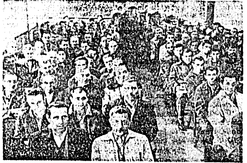
Intrunții în sala Depoului de locomotive într-o adunare de doliu, feroviarilor arădeni au adus un ultim omagiu marelui conducător al poporului nostru, tovarășul Gheorghe Gheorghiu-Dej.

Și în alte adunări de doliu oamenilor muncii — lăudă cuvântul — au exprimat în cuvinte grațioase marea durere de care este cuprins, în aceste zile, întregul nostru popor. Cornel Băluș, împlănar la fabrica „Răsăritul” din Pincota, spune: „Durerea ce mi-a cuprins la aflarea tristei vești, mă face să găsesc cu greu cele mai potrivite cuvinte care să redea toată această suferință. Sint hotărâți să muncească în așa fel încât să fim demni de calitatea de membru al partidului pe care tovarășul Gheorghe Gheorghiu-Dej l-a condus cu atita înțelepciune”. La rândul său, Dumitru Cocușan de la Gospodăria agricolă de stat Pecica a spus: Cu adâncă durere și mare regret am primit tristă știre a încetării din viață a celui mai scump tovarăș, fiul devotat al clasei noastre muncitoare. Mă angajez a nu precupeți nici un efort pentru ducerea la îndeplinire a tuturor sarcinilor de producție și să desăvârșesc o mai via muncă de popularizare a politicii partidului nostru”.