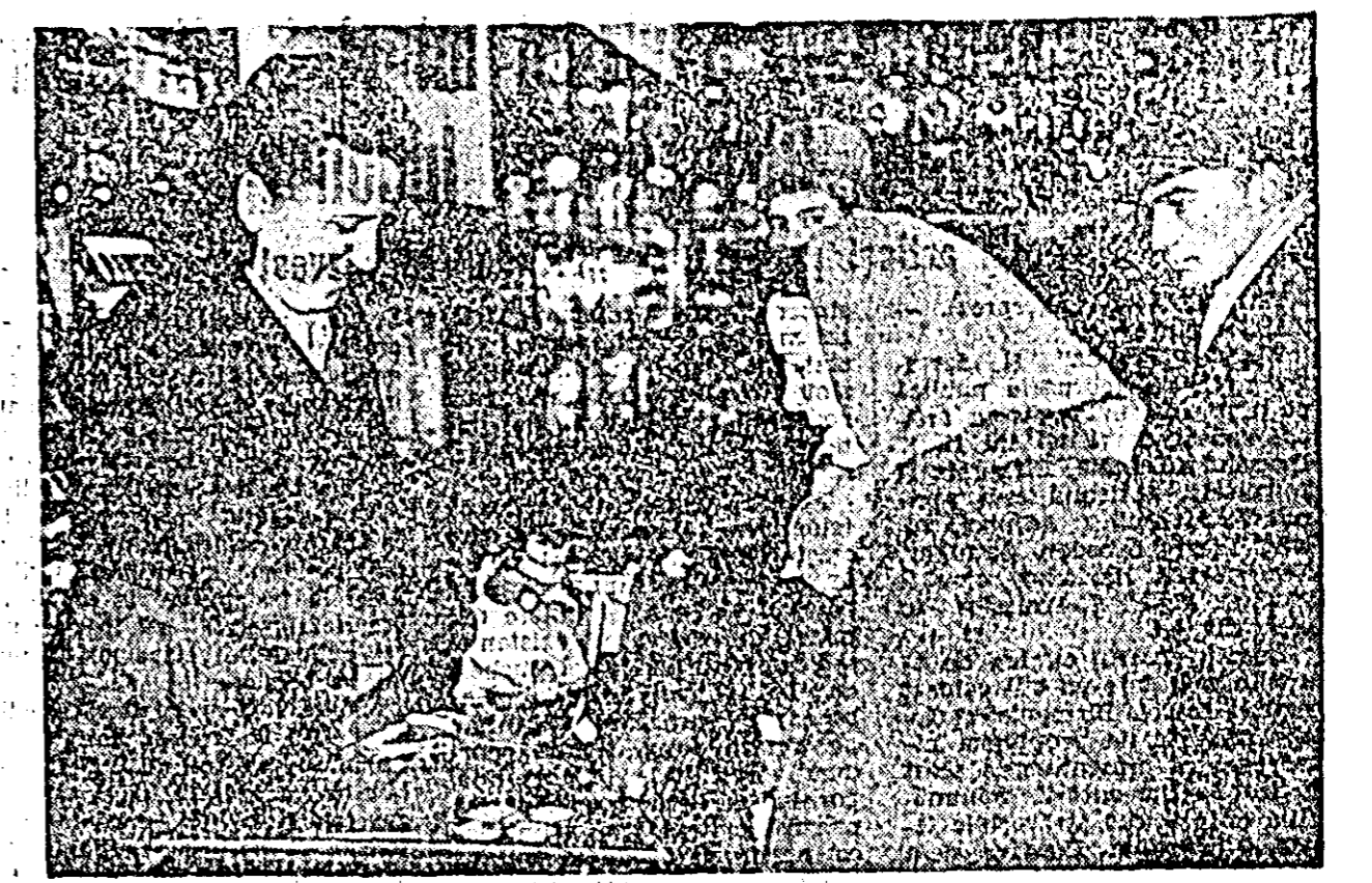
Răsunul menaj de la magazinul „Universul” cunoaște o afliță mare de cumpărători în fiecare zi...