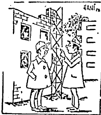
Beneficiarul: Cînd ne predă blocul? Constructorul: Pe asta nu-l predăm, îl lăşăm ca fond de lucru pentru iarnă...

Măsurile pentru lucru pe timpul friguros la obiectivele începute şi certe sînt în majoritate închise. Totuşi o mică parte dintre ele, ca de pildă cele privind sursele de căldură, încă n-au fost terminate. E necesar ca în cel mai scurt timp şi aceste măsuri să fie realizate, astfel ca activitatea de investiţii să se poată desfăşura în ritm susţinut, atît în luna decembrie cît şi în primul trimestru al noului an. De asemenea, tot în luna decembrie constructorii, împreună cu beneficiarii, trebuie să finalizeze toate operaţiunile legate de obiectivele a căror construcţie începe în trimestrul I 1979, în aşa fel ca în anul viitor la obiectivele pentru care există proiecte să nu mai existe nici un fel de problemă, care să tergiverseze lucrările.