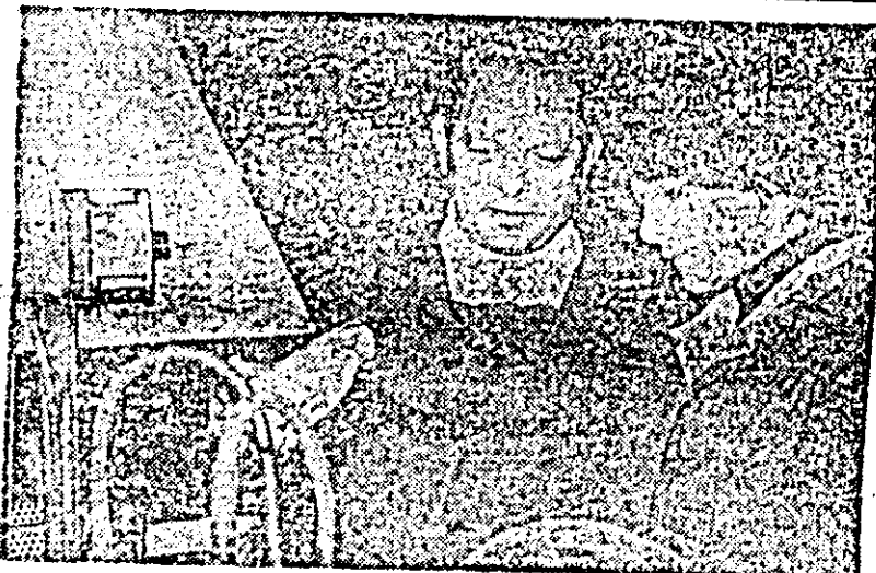
Aspect de muncă de la I.A.M.M.B.A.