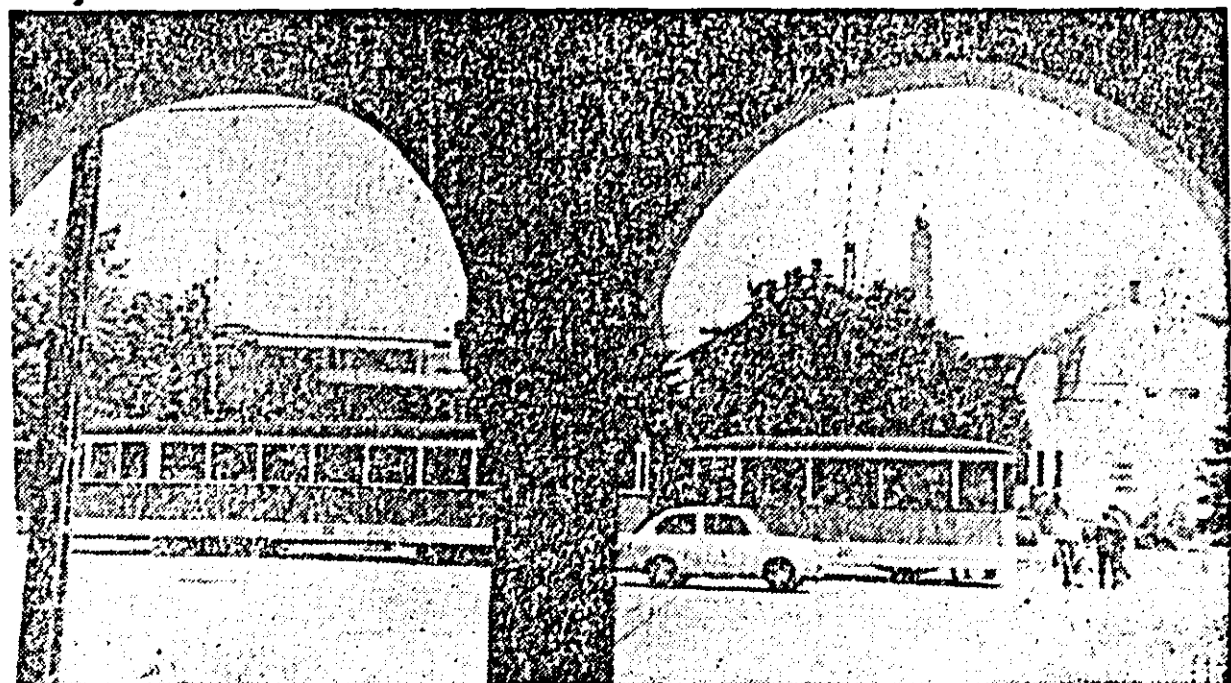
În Plaşa gării electrice.