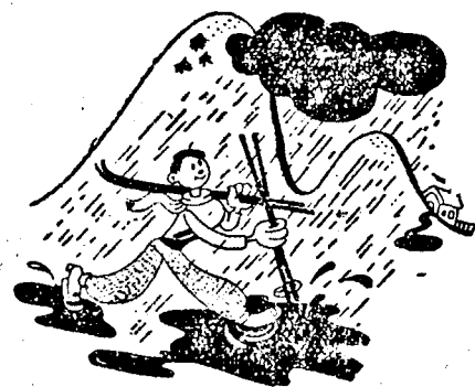
Kép szöveg nélkül.