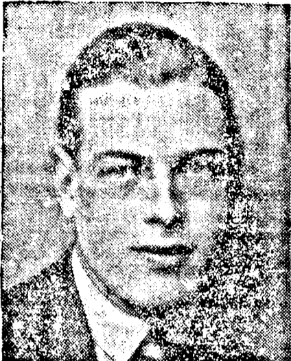
GYÖRGY KENTI HERCEG