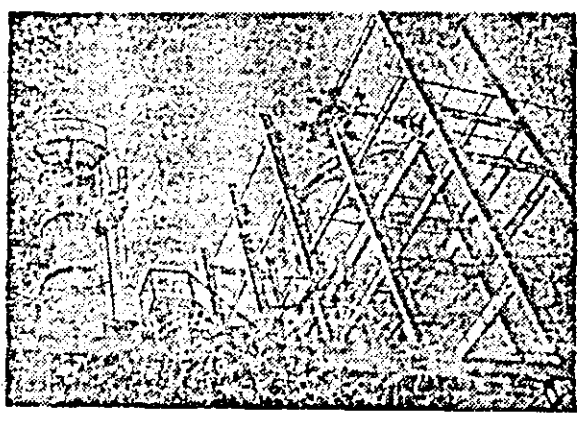
La Combinatul chimic continuă etapa a doua de dezvoltare.