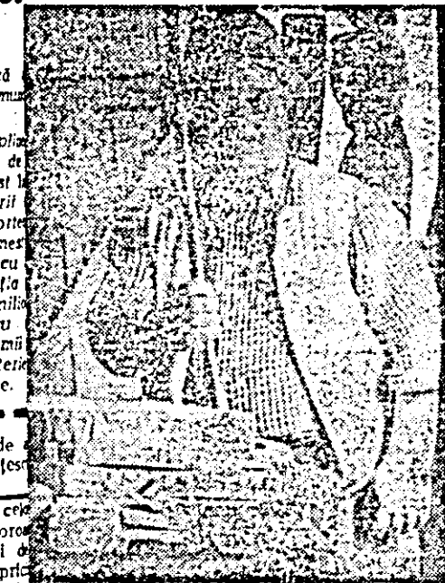
„Rșniță” dintr-o gospodărie de pe Valea Hu- șanișului — Chișinău.

Mai mulți cercetători de la In- treprinderea „Tractorul” au reali- zat o originală soluție pentru im- pregnarea pieselor turnate. Acest procedeu este destinat remedierii defectelor de necetanitate ce apar la piesele jurnate din fontă, oțel sau aliaje neferoase.