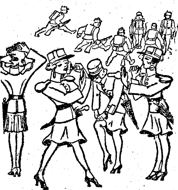
Utolsó simítások a kivonulás előtt...