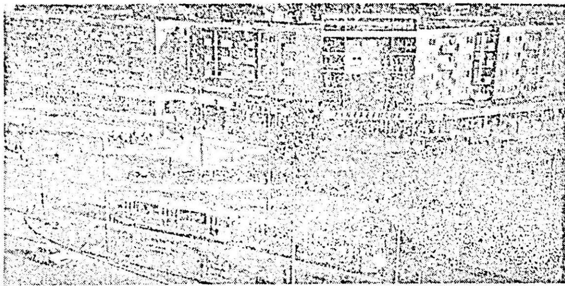
Secvența din noua imaginee, complet întinerită și modernizată a birou-căminului piețele UTA din municipal Arad.