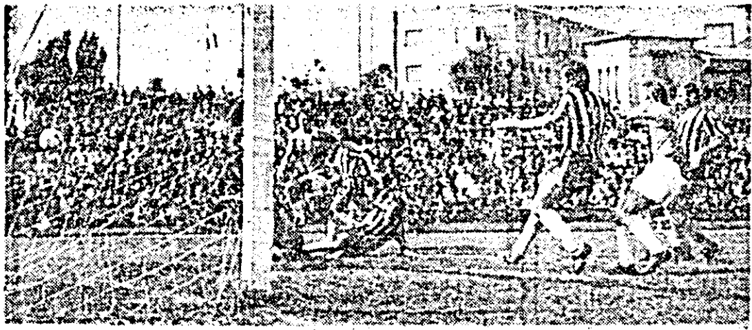
Fază fierbinte, de mare spectacol la poarta fotbalistilor din Brad.