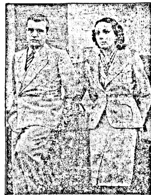
Bruno Mussolini, fiul Ducei, mort eroic în împrejurările cunoscute și soția sa.

ROMA, 9. (Rador). — Presa italiană de Vineri exprimă profunda durere încercată de poporul italian cu ocazia morții eroice a lui Bruno Mussolini. Sunt publicate telegramele de condoleanțe prin care reprezentanții tuturor națiunilor își exprimă profundele lor regrete față de moartea timpurie a căpitanului Bruno Mussolini a cărui îndrăzneală și competență aeronautică erau pretutindeni admirate.