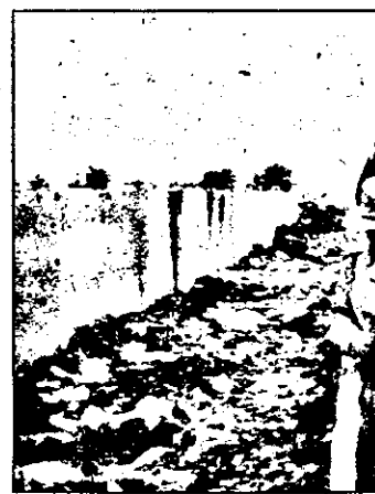
Rampa de gunoi a orașului e în curs de amenajare.