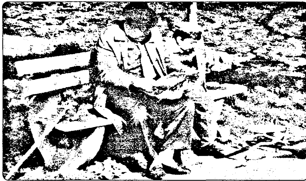
Două generații. Fiecare cu grija ei...

Actuala coaliție dorește să guverneze țara și în următorii patru ani care vor urma alegerile de la 8 mai, a susținut Boross care, în pofida rezultatelor sondajelor de opinie, a fost de părere că nu este de prevăzut o orientare notabilă spre stânga a electoratului. Asta însă, doar alegerile o vor hotărî, a mai admis premierul.