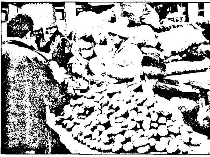
La Arad, pe piața țărănească, în condițiile unei oferte deosebit de mari, prețul cartofilor a scăzut de la peste 200 la 160 de lei. Legea cererii și a ofertei își spune tot mai mult cuvântul...