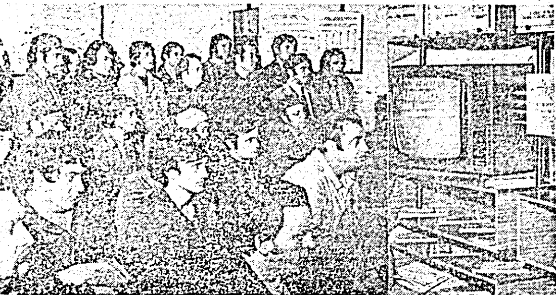
Din primele clipe ale începerii lucrărilor Conferinței Naționale a partidului, numeroși conducători de strunguri s-au adunat în fața televizorului.

Asemeni întregului nostru popor, comuniștii, toți oamenii muncii arădeni — români, maghiari, germani și de alte naționalități — au urmărit cu deosebit interes deschiderea în Capitală a lucrărilor Conferinței Naționale a partidului, eveniment de importanță fundamentală în viața partidului și a țării. În jurul aparatelor de radio și televizoarelor, numeroși oameni ai muncii au ascultat cu entuziasm, cu îndreptățită mîndrie patriotică Raportul prezentat Conferinței de către tovarășul Nicolae