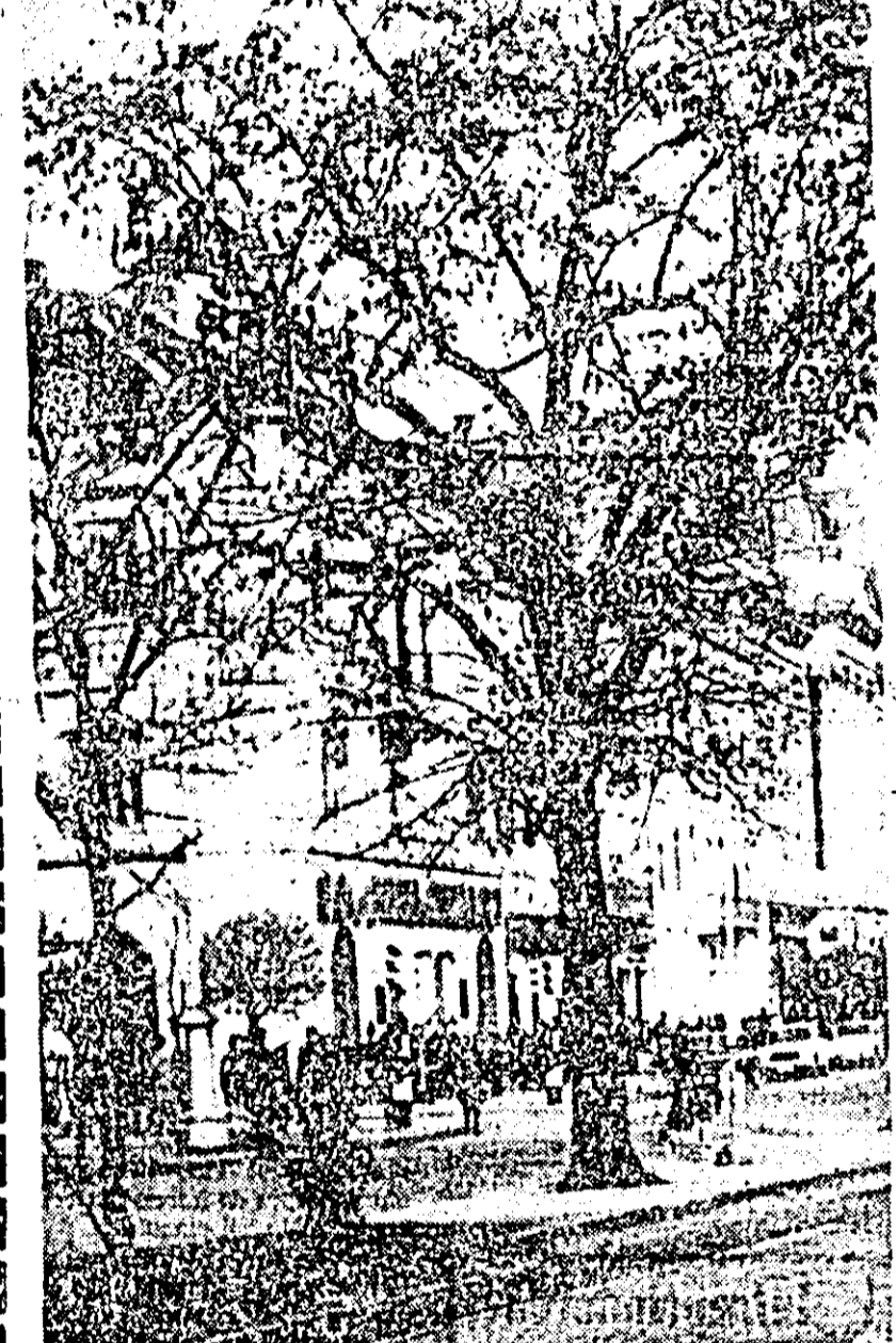
DIN NOU DESPRE TOAMNĂ.

au rămas nefructificate. S-a combinat excesiv în căutarea poziției ideale, poarta a fost răncerată, de parcă fiecare se temea de răspunderea trasului la poartă. Repriza se încheie astfel nedefinit. La scurtă vreme după reluare, scorul este deschis: Czako I execută excepțional, prin zid, o lovitură liberă de la 17 m și înscrie. Am înregistrat în această parte a jocului și o perioadă cînd oaspeții au preluat inițiativa, dorînd să egaleze. Situația nu s-a menținut prea mult, C.F.R. reușind să echilibreze jocul. Am mai reținut, de asemenea, ca un fapt îmbucurător, o mai mare frecvență a șuturilor pe poartă. Dacă au rămas fără rezultat, aceasta se datorește intervențiilor talentatului portar bîimărean Ziller, precum și pripelii atacanților de la C.F.R. Ori cum, deși a cîștigat la limită, C.F.R. Arad a evoluat pronișitor în compania unui adversar care nu este lipsit de valoare. C.F.R. a folosit formația: Wesser — Cotarcă, Bernozor, Cukla, Cocuiban — Vlad, Gligor — Beșucă, (Damian), Körösi, Mihoc, Czako I.