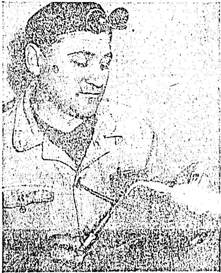
Fruntășă în această privință este comisia pentru descoperirea și valorificarea rezervelor interne de la moară, al cărei membru a făcut în această perioadă opt propuneri care duc la obținerea de 70.000 lei economii anuale.