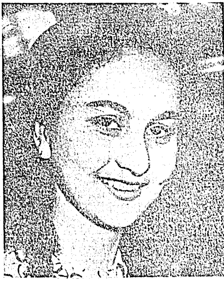
Fruntășă în această privință este comisia pentru descoperirea și valorificarea rezervelor interne de la moară, al cărei membru a făcut în această perioadă opt propuneri care duc la obținerea de 70.000 lei economii anuale.