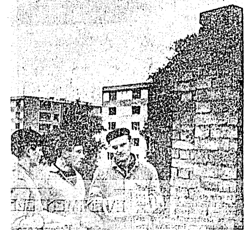
La blocul G din cvartalul Podgoria lucrează și zidarii tineri, începători în meserie. Un sfat, o explicație, le prinde întotdeauna bine. De data această obiectivul fotografic a surprins o asemenea „consfățuire”.