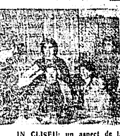
ÎN CLIȘEU: un aspect de la cercul de citit.