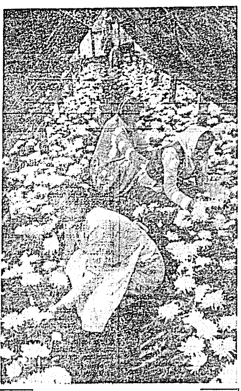
E toamnă tirzie și întreaga natură se pregătește pentru iarnă. Doar aici, în serele grădiniștii orașului, e primăvară veșnică. Prin grija deosebită a oamenilor care lucrează aici, florile sînt ferite de capriciile vremii, se dezvoltă nestingherite, împodobindu-ne și în anolimpul rece locuințele, vitrinele, birourile.

Navele vor fi construite la un înalt nivel tehnic și dotate cu echipamente și utilaje moderne asigurîndu-se un înalt grad de automatizare. Livrarea acestor nave urmează să se efectueze începînd din trimestrul IV 1965, eşalonat pînă la finele trimestrului III al anului 1967. Valoarea contractului este de cca. 36 milioane dolari. Plățile se vor face — în cadrul echilibrului romino-japonez în mod eşalonat, pînă în anul 1974 inclusiv. (Agerpres)