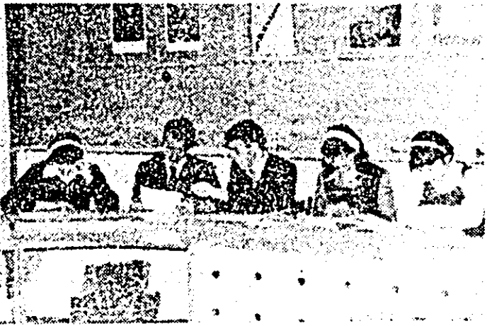
Elevii premiați la olimpiadele pe materii.