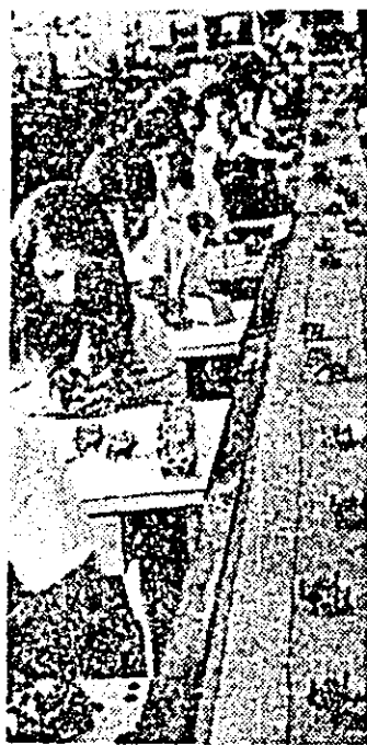
Aspect de muncă de la banda de montaj a întreprinderii de ceasuri „Victoria”.