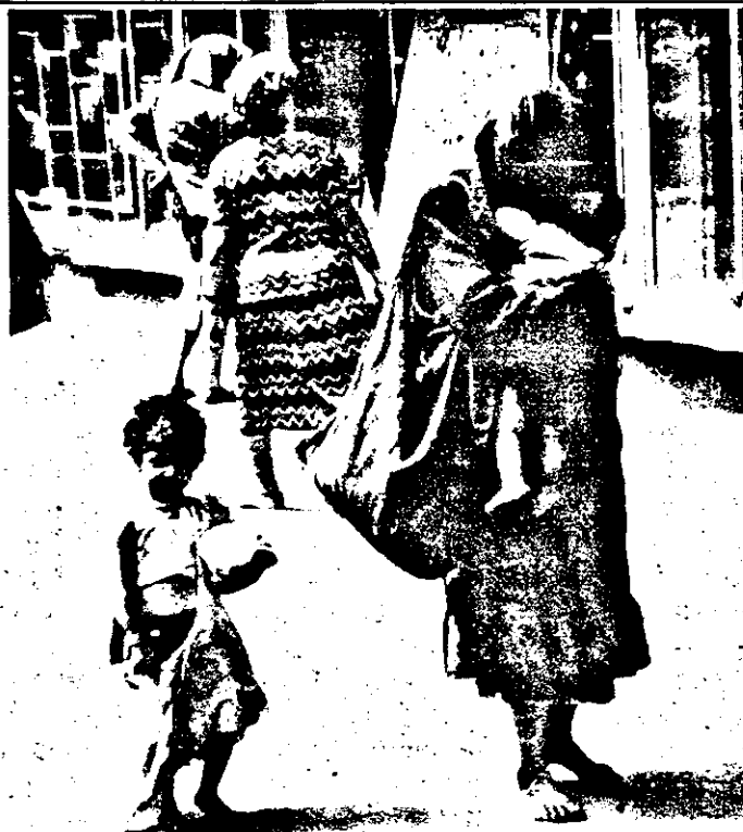
Îi întâlnești peste tot - pe bulevard, în tramvai, în tren, în magazine - urând aspectul orașului. Au fost sesizate și Primăria și Poliția, dar fără nici un rezultat. Prezența cerșetorilor șochează, și mulți străini ne judecă, din păcate, după aceste imagini...