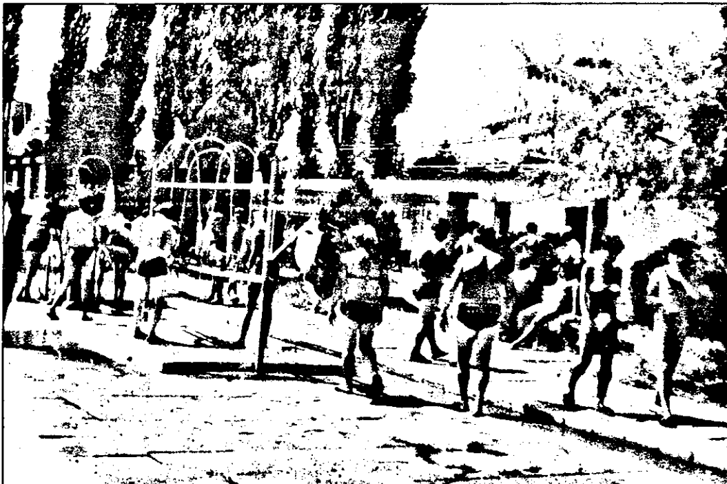
Dacă în bazin nu prea îți vine să intri din cauza buruienilor de pe bordura sa, dacă plajă faci mai greu din cauza crengilor de pe peluzele cu iarbă, un duș, totuși, se poate face. Evident, e vorba de Băile termale Gai.