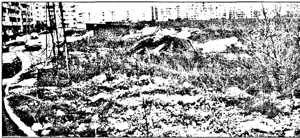
Unul din cele mai frumoase cartiere, Micalaca zonă III. Deși având o arhitectură deosebită, spațiile verzi pe care alții le doresc și nu le au sunt sufocate de gunoie, moloz și chiar de caroserii de autoturisme!

Redacția: Într-o recentă adresă primită din partea SC Salubritate