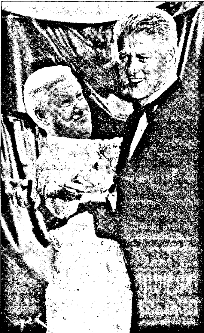
HELSENKI - 1997: UN TANGO PENTRU EUROPA

Boris Elțin și Bill Clinton au discutat în cursul summit-ului de la Helsinki, un plan cuprinzător de stimulare a investițiilor americane în Rusia, partea rusă cerînd cu insistență accesul în organizațiile economice mondiale, informează REUTERS.