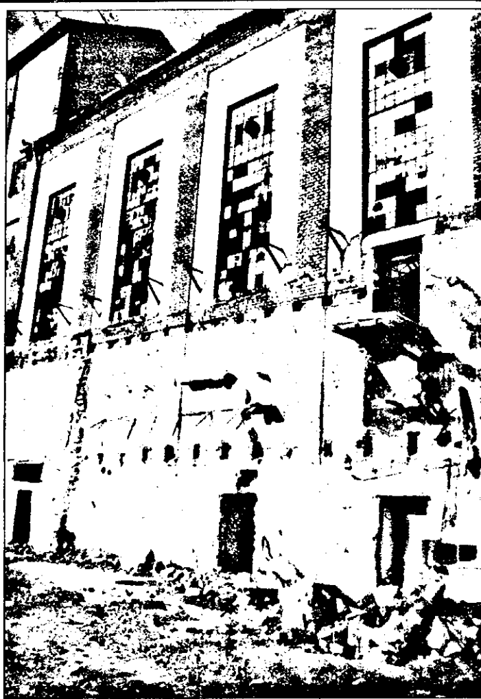
Așa arată, la exterior, una dintre halele celei mai vechi fabrici de zahăr din țară...