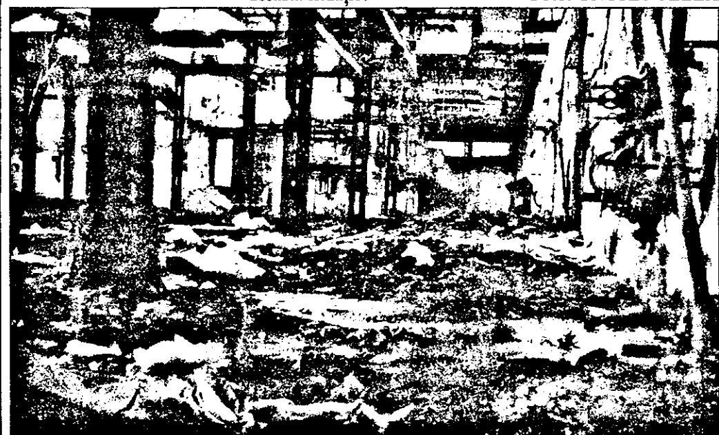
...Și așa în interior