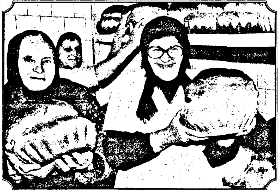
Pâinea - un „argument forte” folosit de inginerul Muscă în relațiile cu țărani asociați.

să fie ale lor. Noi am reușit să-l convingem pe dl. ministru că societatea noastră agricolă