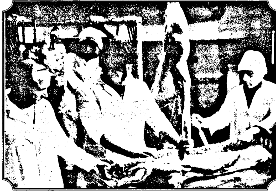
Anul 1993 a însemnat pentru Agrocombinatul Curtici intrarea în producție a unei noi investiții: este vorba despre abatorul de la Complexul de porcine Macea.