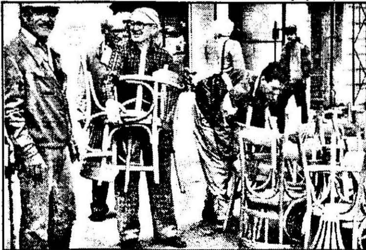
Scaunele-s pregătite. Măine, arădenii vor hotărî cine vor fi cei care le vor câștiga.