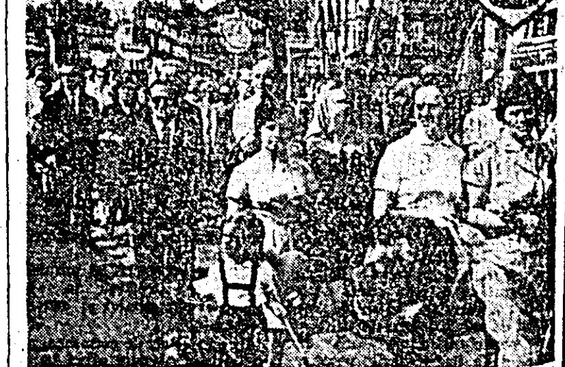
Tineri și vârstnici participă cu același viu entuziasm la marea sărbătoare.

Peste coloane se înalță alte gratice și panouri. Sînt ale colectivelor de la „Tehnometal”, „1 Iunie”, „Teba”, TRCB. Cu toții în să arate îndrăgii popor că sarcinile cincinalului se înfăptuiesc.