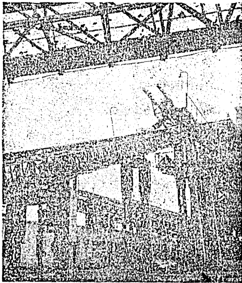
Dantelărie din oțel (balastiera din Ghloroc).