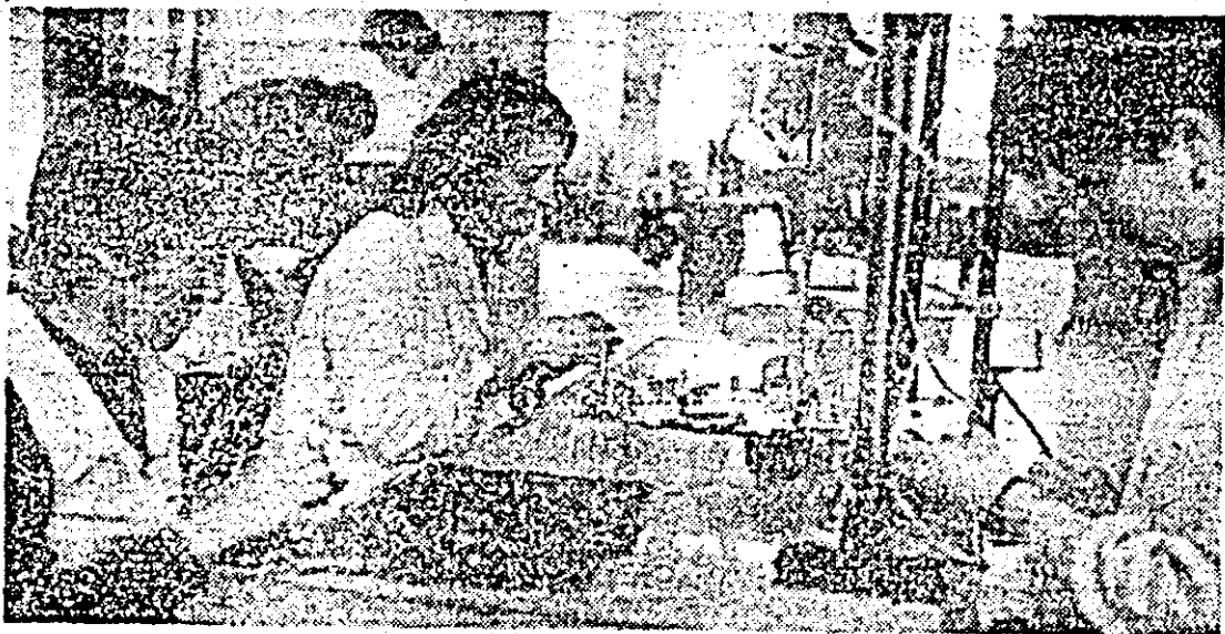
În atelierul montaj al întreprinderii de orologerie industrială.