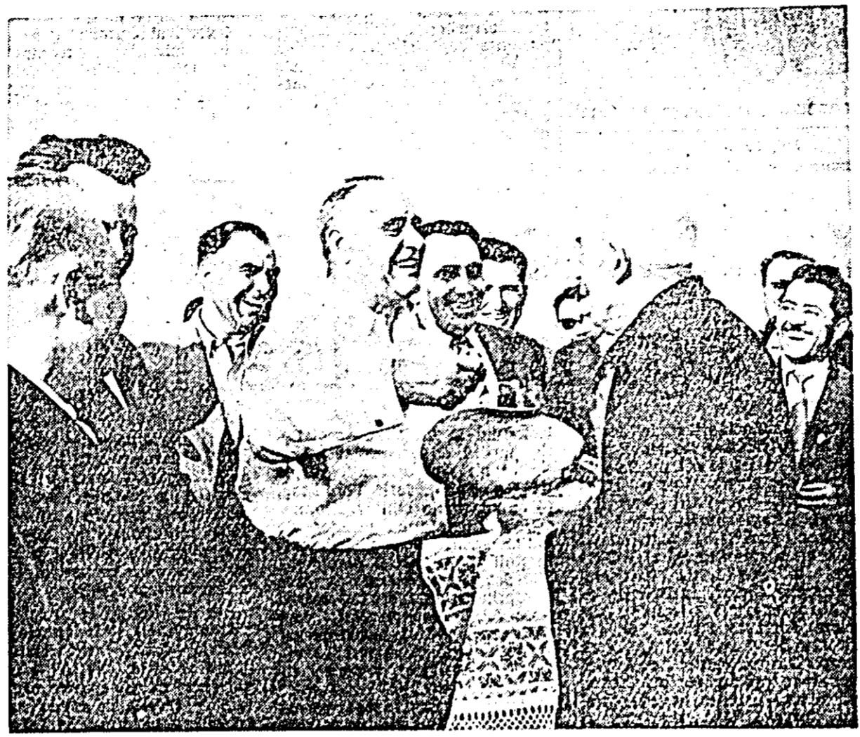
La gospodăria agricolă colectivă „Victoria” din Lenuaheim

La cvarțialul de blocuri din străzile Enescu și Paris se constituiesc blocuri cu 219 apartamente, din care 125 sînt deja gata. Oaspeții s-au interesat de metodele de construcție, de ritmul de lucru, de prețul de cost al aparta-