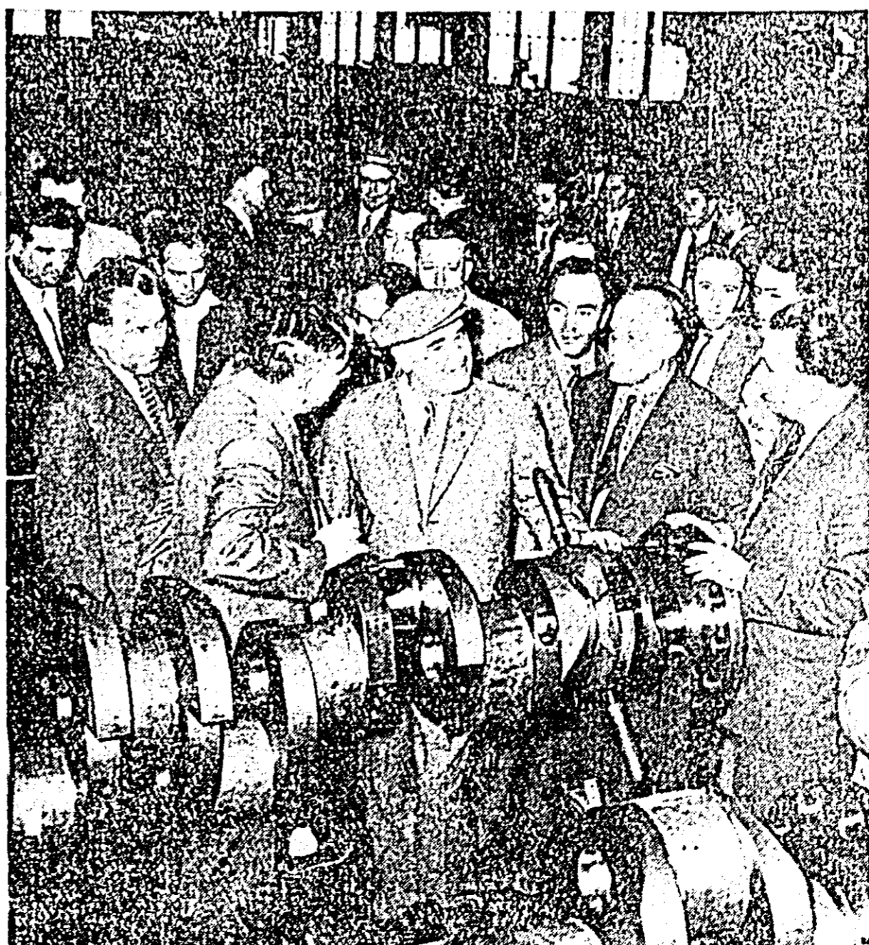
La fabrica de motoare Diesel electrice de la Reșița