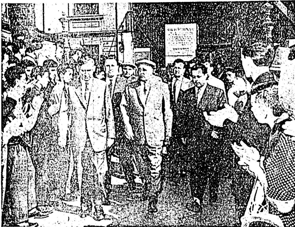
În vizită la combinatul de la Reșița

...se va organiza azi 22 Iunie un simpozion la filmul sovietic „Serioja”.