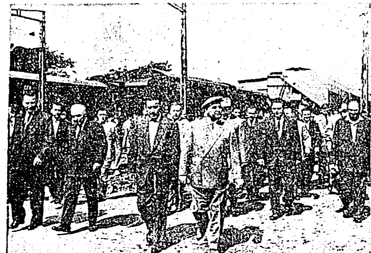
Conducătorii de partid și de stat în vizită la uzinele „Gheorghe Dimitrov”.

Paralel cu secerișul, avansează și lucrările de arături în miriște în urma eliberării terenurilor de păioase. Majoritatea gospodăriilor colective însămîntează în aceste arături plante de nutreț necesare hrînirii animalelor. Pînă zilele trecute, colectivitățile din Semlac, Sînpetru German, Mănăștur și alții au reușit să însămînteze suprafețe întinse în vederea producerii de porumb siloz.