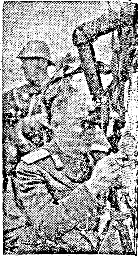
Generalul ION ANTONESCU, Comandorul Statului, pe front, observă acțiunea artileriei

Exista însă o mare deosebire între jocul de șah unde mișcările au efect prevăzut și limitat și câmpul de luptă, unde inițiativa subșefilor se îmbină în planurile înăltului comandament. Un lucru este sigur, închee expertul militar german, că forțele Reichului nu luptă pentru „linii și fronturi” ci pentru nimicirea totală a adversarului.