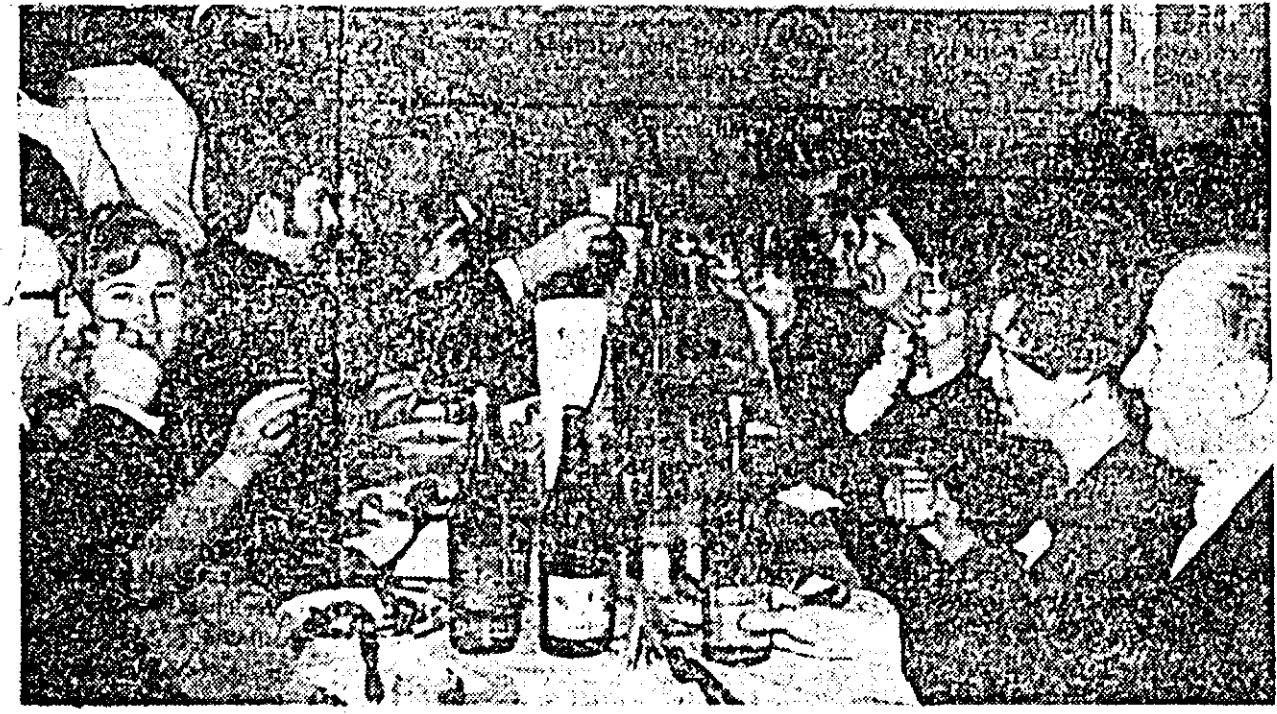
Toast pentru noul venit — anul 1972.

de melodii preferate și adecvate clipelor dedicate revelionului. Nimic extraordinar în această noapte de petrecere,