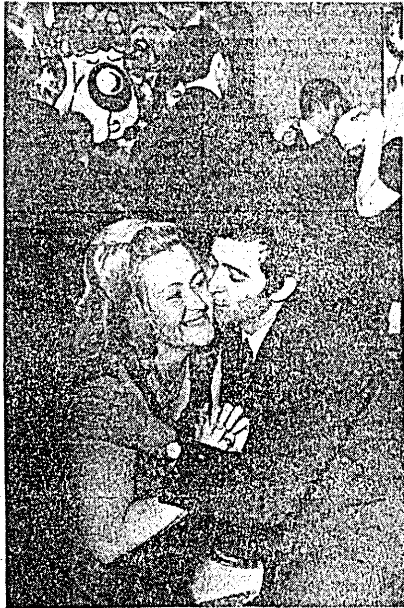
...Și peste tot Perința.