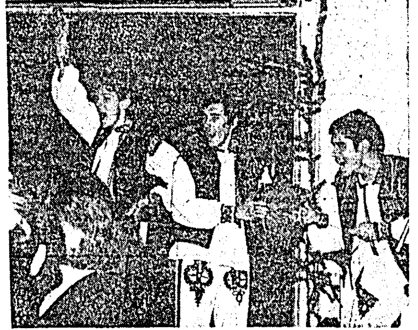
Moment din tradiționalul „Plușor” al tineretului.

Într-o altă sală din municipiu, 200 de elevi de la Școala UCECOM petreceau noaptea de cumpădă. Într-o