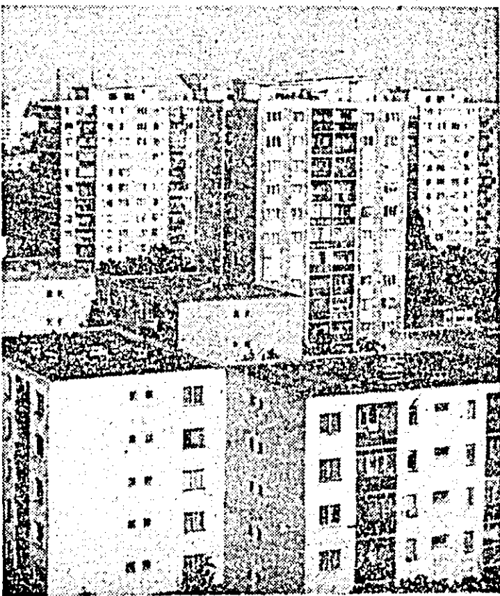
Arad. Blocuri noi de locuințe în zona Căii Aurei Vlatcu.

În timpul convorbirii, oaspetele a exprimat înalta apreciere pe care președintele Republicii Libaneze o acordă acțiunilor și inițiativelor României, ale președintelui Nicolae Ceaușescu în vederea rezolvării problemelor din Orientul Mijlociu și din Liban. Înăpturii aspirațiilor de pace și libertate ale poporul libanez.