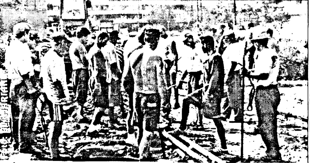
Începând cu 10 august și până duminică, 12 august, între Banca Comercială și Gara mare, pe o porțiune de 150 m, se lucrează la înlocuirea liniilor și traverselor la linia de tramvai. Lucrarea este executată de „Edil Construcții”. În această perioadă transportul de persoane de la Gară până la Podgoria se execută cu autobuze.