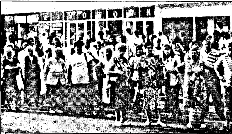
Sute de oameni așteptau autobuzele promise. Dar... degeaba!