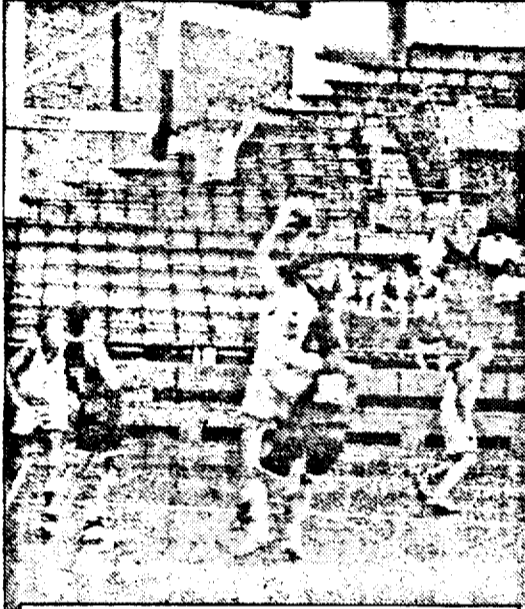
O aruncare cât o victorie...