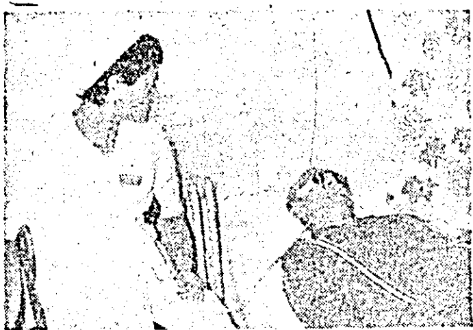
În stațiunea balneară Lipova oamenii muncii veniți la tratament li se acordă toată îngrijirea. În imagine: as- pect din secția de fizioterapie unde se execută ionizări cu sulfat de magneziu.