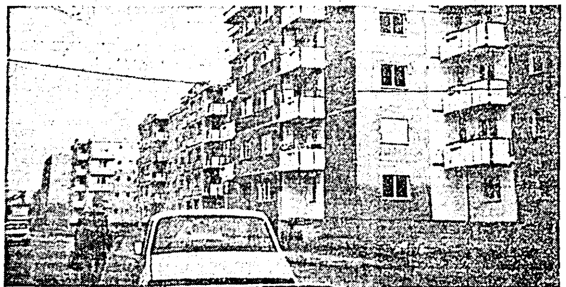
În zona străzii Miron Costin prinde tot mai mult contur un nou cvartal de blocuri.

• Linia nr. 2 continuă să dețină — de departe, potrivit scizărilor primite — primul loc în acel clasament — cituși de puțin onorabil — al întîrzierilor, tramvaiele cu pricina circulînd după o logică și program greu de înțeles. Și, evident, de acceptat. Drept pentru care, un cititor propune ori desființarea liniei ori schimbarea ghinionistului