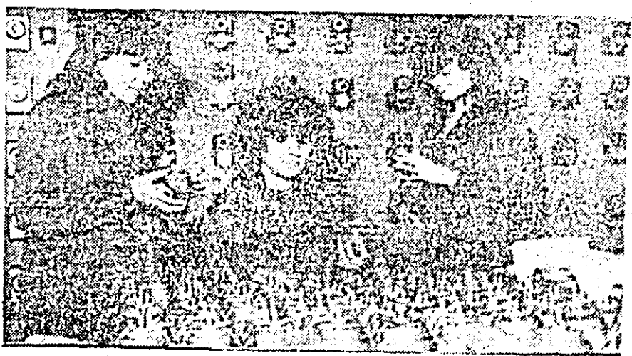
Aspect din laboratorul de încercări și verificări cinematice al întreprinderii de orologerie industrială.