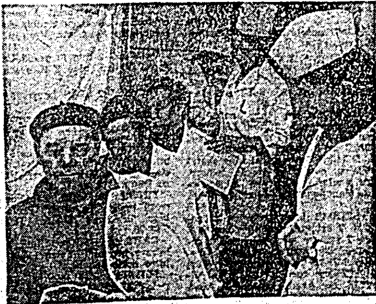
O imagine care vorbește de la sine: La Întreprinderea de strunguri donatori onorifici de sînge stau la coadă.